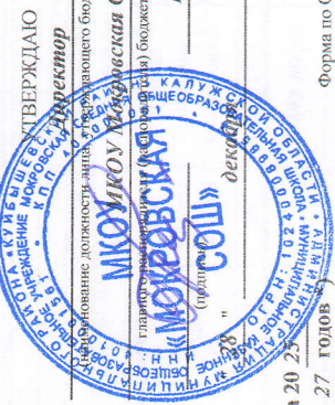
Раздел 1. Итоговые показатели бюджетной сметы

Получатель бюджетных средств Распорядитель бюджетных средств Главный распорядитель бюджетных средств Наименование бюджета Единица измерения: руб